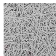
Vezelbreedte 0,75 mm