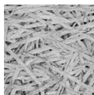
Vezelbreedte 1,5 mm